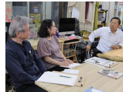
商店街に出かけて、まちづくりについて直接お話を伺います。

「何かしてみたい!」「地域の役に立つことをやってみたい!」と思った方は、一緒に学びましょう!