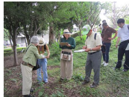
身近な所で豊かな植生とふれあいながら学びます。

基礎コースや応用コースを修了すると、「修了生」のサークル、『コーディネーターズサークル』に登録でき、仲間との交流やスキルアップの場も得られ、共に活動する仲間とも出会えます。