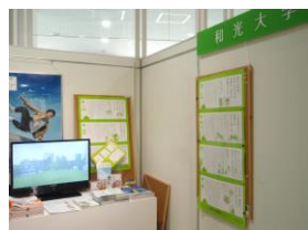
大学情報コーナー和光大学ブースでご覧いただけます。

小田急線の車内広告「和光3分大学」をご覧になったことはありますか？社会で遭遇するさまざまな疑問に、和光大学の教員が解説するもので、平易な文章で分かり易く解説しながら、実はその奥に非常に深い学問的見地の裏付けがあります。学ぶことは社会と無関係ではなく、必ず役に立つことなのだ。そんなことも、ほんのひと駅の間を実感していただくことができます。