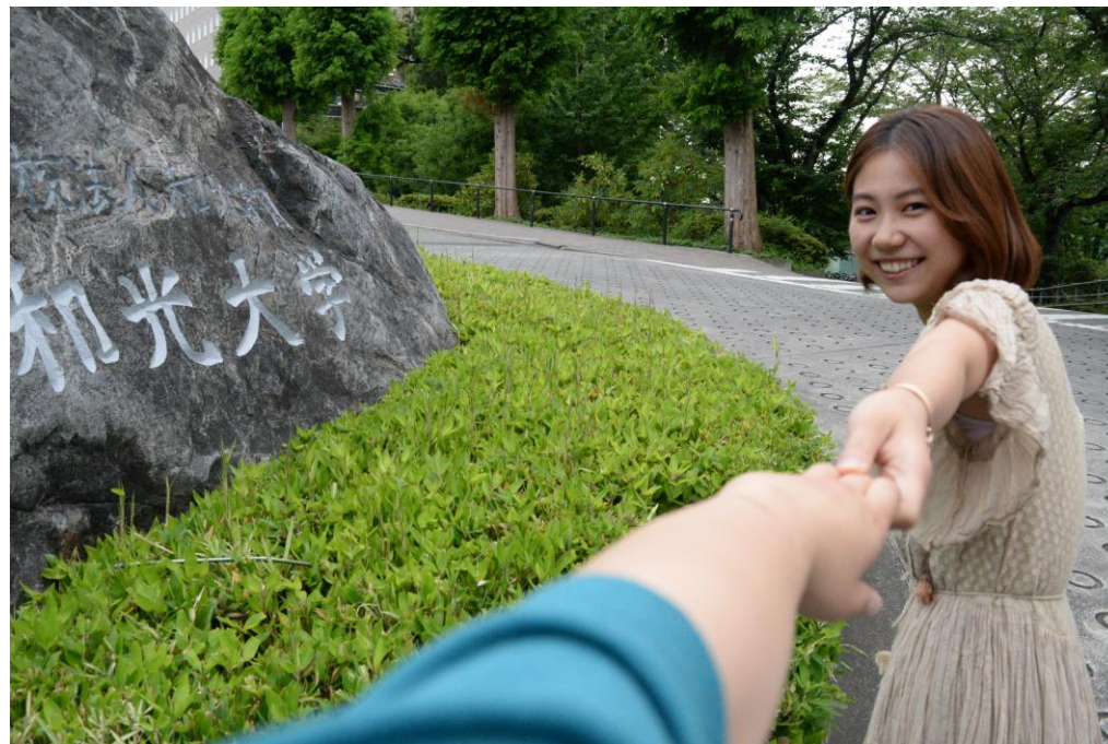
ユニコムプラザさがみはらの大学情報コーナーに出展している大学等の地域連携活動をご紹介します