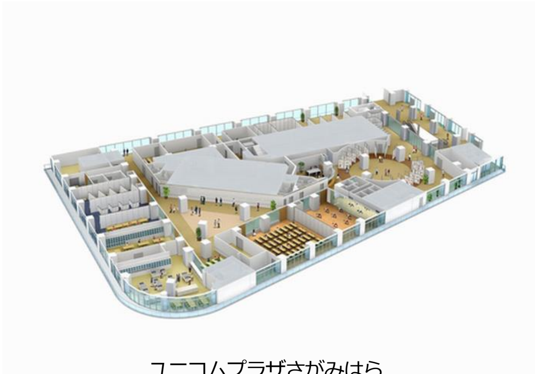
ユニコムプラザさがみはら